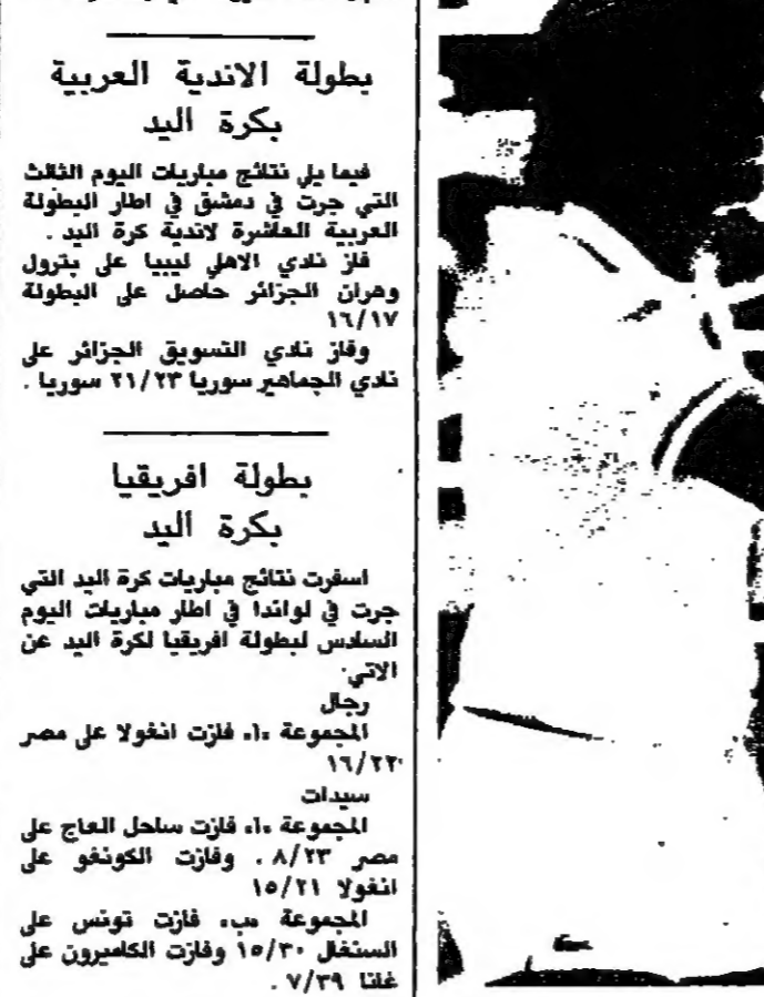
اللاعب الفرنسي هنري لوكوتت (١ ب - ف - رايو)

اسفرت مباريات الدور الثاني في تصفيات جائزة لوس انجيلوس الكبرى لكرة المضرب عن فوز الامريكى جيمي ارياس على الامريكى بول ميكليس ٧-٥، ٦-٦، ٦-٦. ٦-٦ والامريكى بول انتونين على الامريكى فينس فن بلتن ٧-٦، ٦-٦، ٦-٦. ٣-٦ والسويدي ستيفن اويرغ على الامريكى برايد بيرس ٦-٦، ٦-٦، ٦-٤. والامريكى برايد غيلبرت على البريطاني جون لويد ٧-٦، ٥-٦، ٦-٦. دورة شيكاغو وعلى صعيد تصفيات دورة شيكاغو، فازت الاوسترالية وندي تورنيول على الامريكى كيت غوميرت ٦-٦، ٤-٦، ٦-٣. والامريكى سورزان ملسكارين على الكندية كارلينغ باستيت ٦-٦، ٦-٤، ٦-٤. والامريكى كاتي جوردان على الامريكى رولين وايت ٦-٦، ٦-٣، ٦-٦. والامريكى كاتي وينكلي على الامريكى ماري لوبيانك ٦-٦، ٦-١، ٦-١. والامريكى بريارة بوتز على الامريكى جوان راسل ٦-٦، ٦-٧، ٦-٦.